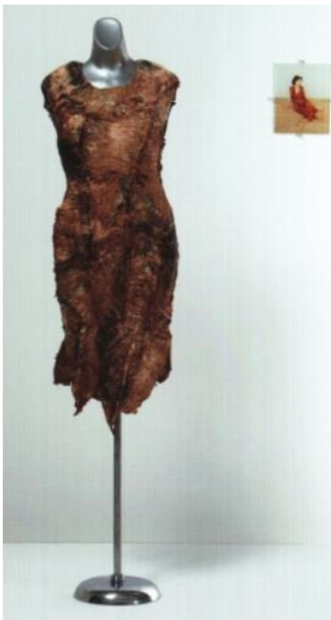
Jana Sterbak, « Vanitas : robe de chair pour albinos anorexique » (1987)