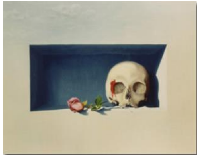
René Magritte, « La mémoire » (1948) peinture à l'huile (60 x 50 cm)