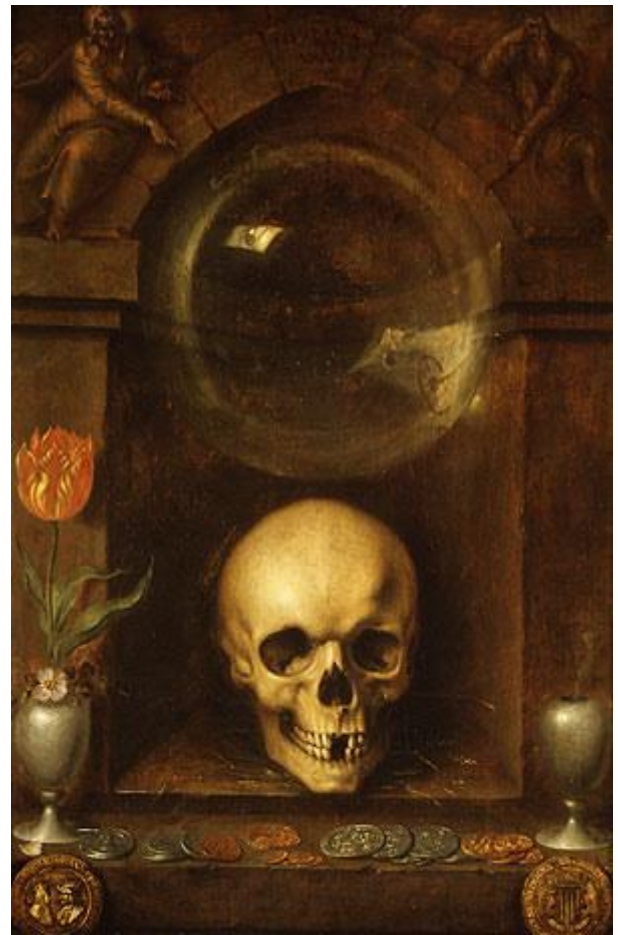
Jacques de Gheyn, Vanité (1603). Metropolitan Museum, New York