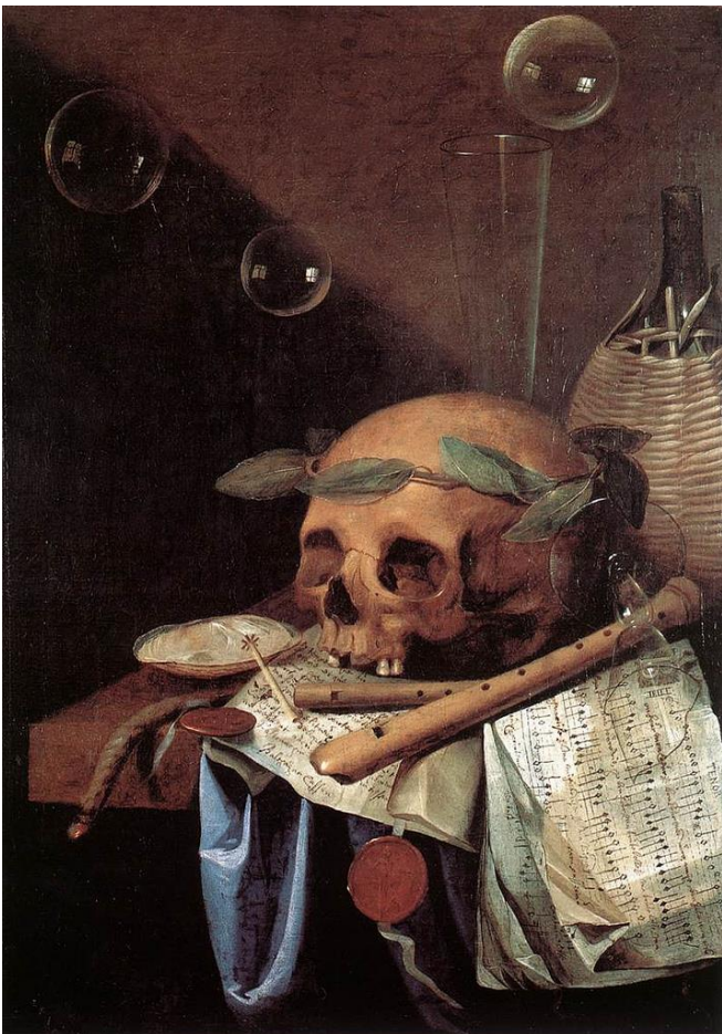
Simon Renard de Saint André, Vanité (1650). Musée des Beaux-Arts, Lyon