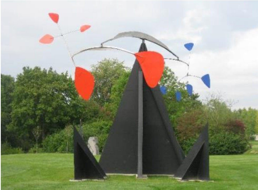
Sculpture de Calder au LaM (Lille Métropole musée d'art moderne)