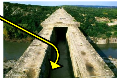
Photographie du Pont du Gard (élément de l'aqueduc de Nîmes)